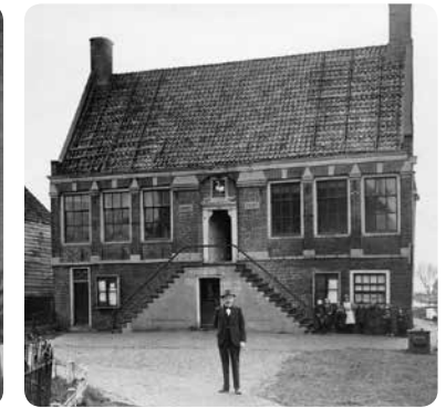
Raadhuis in Ransdorp